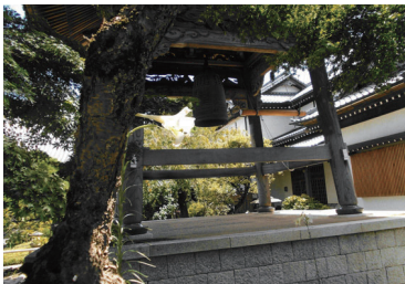
入選 NPO法人まちづくり活性化土浦賞 「鐘と鉄砲百合」中田 文夫