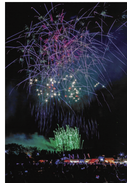
入選 土浦写真家協会賞 「夜空の鳳仙花」八田 淳