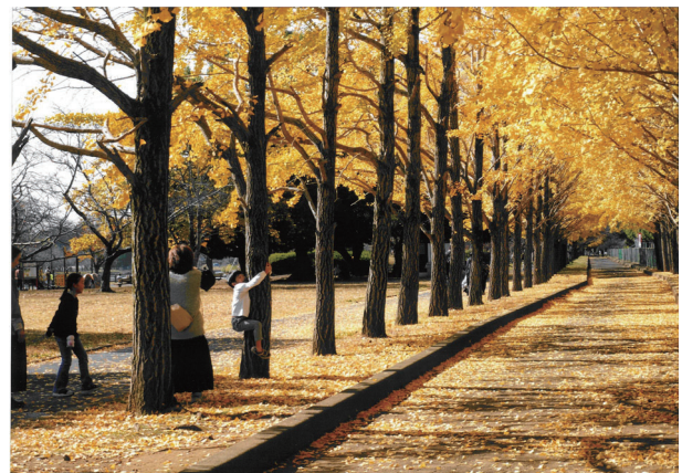
優秀賞 土浦商工会議所会頭賞 「家族みんなで紅葉狩り」木内 純子