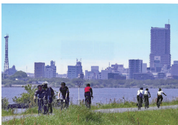
入選 土浦写真家協会賞 「リンリンロード」加納 朝子