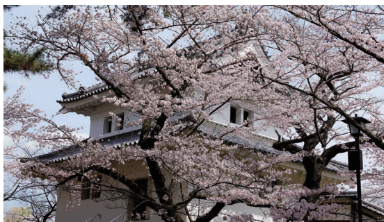
亀城公園（土浦城址）

土浦の象徴でもある亀城公園は室町時代に築かれた土浦城址。櫓門は城郭建築の遺構としては関東唯一のもので、園内には約50本のソメイヨシノがあり、櫓や堀との調和は格別で花見の人気スポットです。 【土浦市中央一丁目13番】