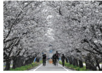
入選 土浦市議会議長賞 「桜の道」滝本 光晴